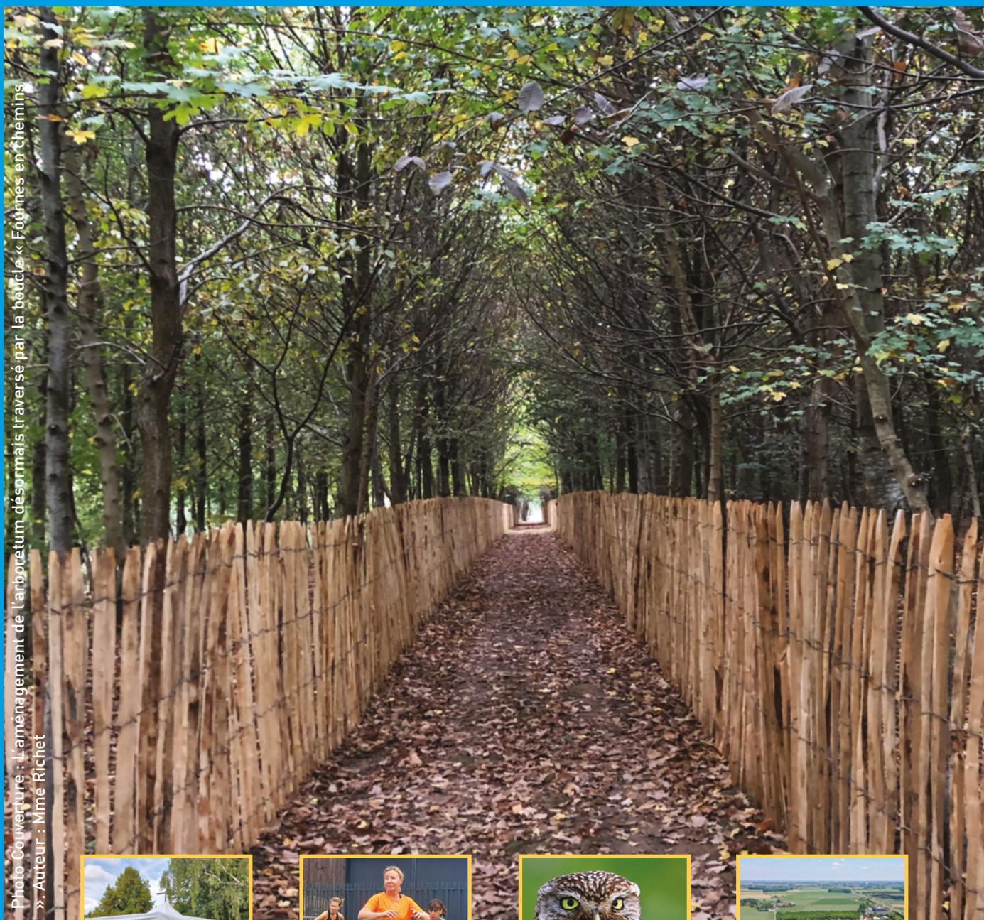
Photo Couverture : L'aménagement de l'arboretum désormais traversé par la boucle « Fournes en Chemins » » -Auteur : Mme Richet