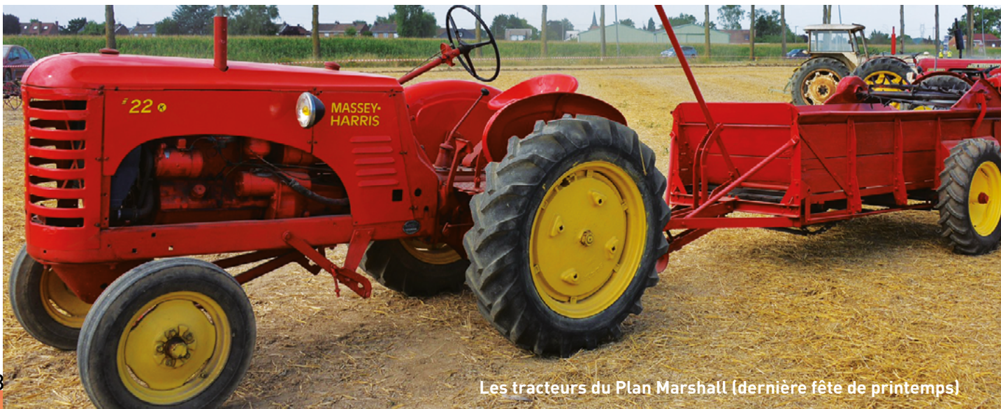
Les tracteurs du Plan Marshall (dernière fête de printemps)

Petit rappel : atelier tous les jeudis 14-17 heures au Bas Flandre Contact : Jean-Pierre Vaesken-06 63 42 23 45 (Président).