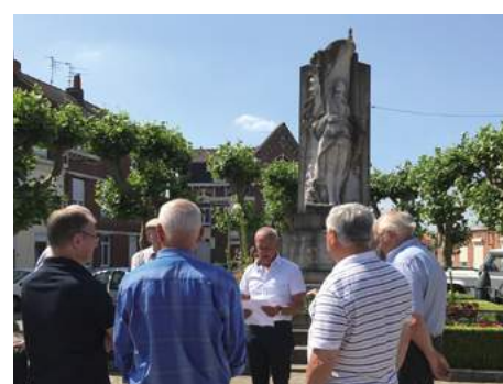
Appel du 18 juin 1945