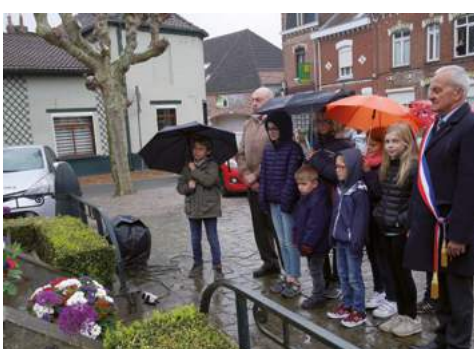
Armistice 8 mai 1945