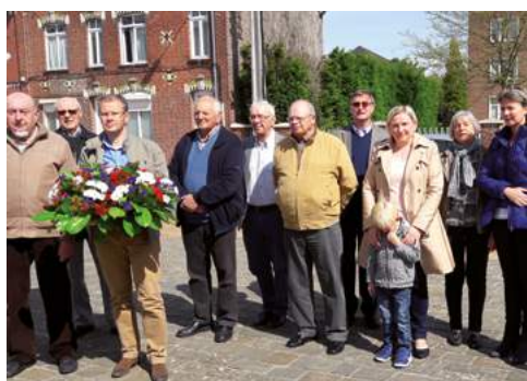
30 avril Journée des déportés