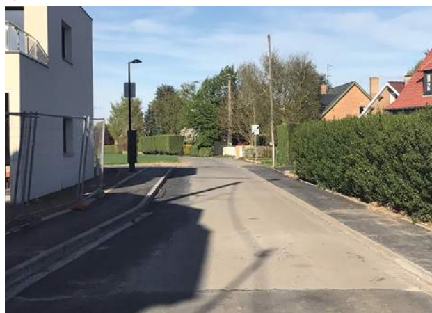
▼ Rue Jules Ferry