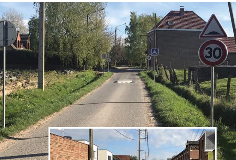
◀ Coussin berlinois Hameau des Prés