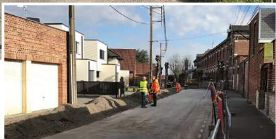
Rue Raoult ▶