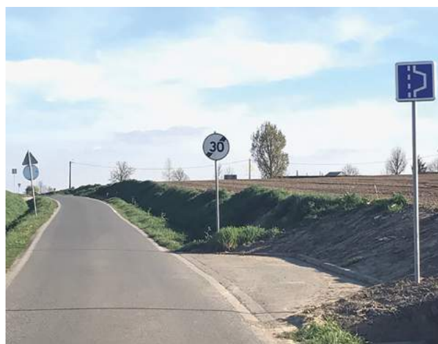
Zone 30 et aire de croisement Hameau des Prés ▶