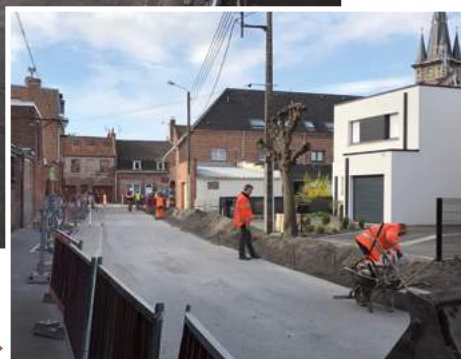
Rue Raoult ▶