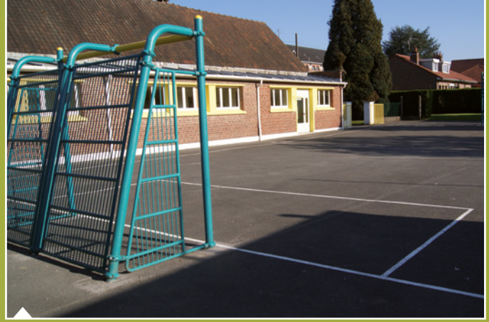
Aménagement de la cour de l'espace Raoult en citystade.