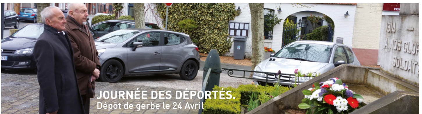
JOURNÉE DES DÉPORTÉS. Dépôt de gerbe le 24 Avril