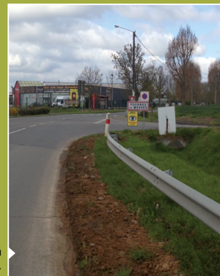
Travaux de création d'un poste EDF pour alimentation de la zone maraîchère et horticole de Wavrin.