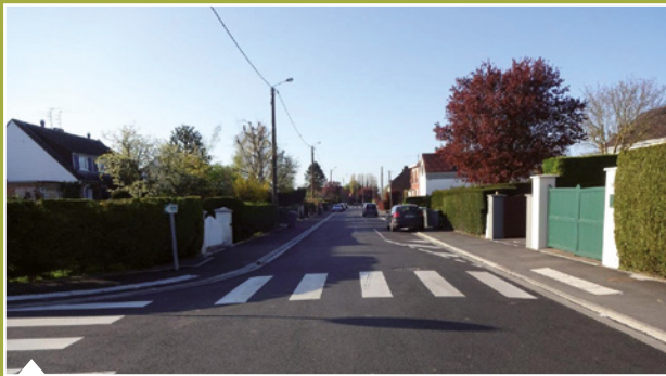
Signalétique stationnement des voitures sur la route rue Thiers.