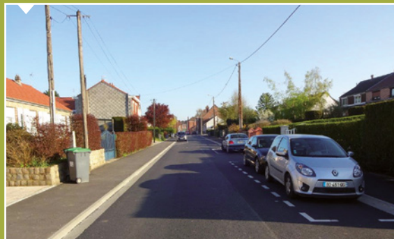
Rue Thiers, travaux de voirie, route, trottoirs et signalétique.