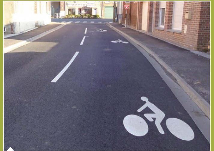
Signalétique pour la sécurité des vélos rue Thiers.