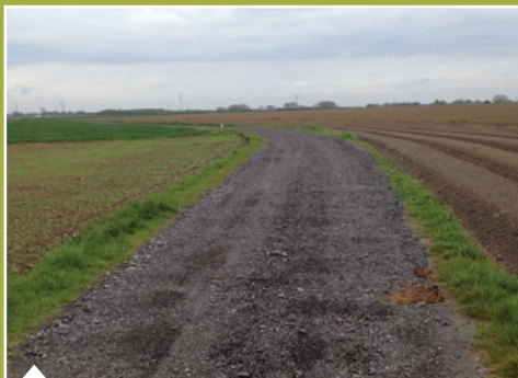
Remise en état du chemin du Buf (chemin vers le bois de Ligny).