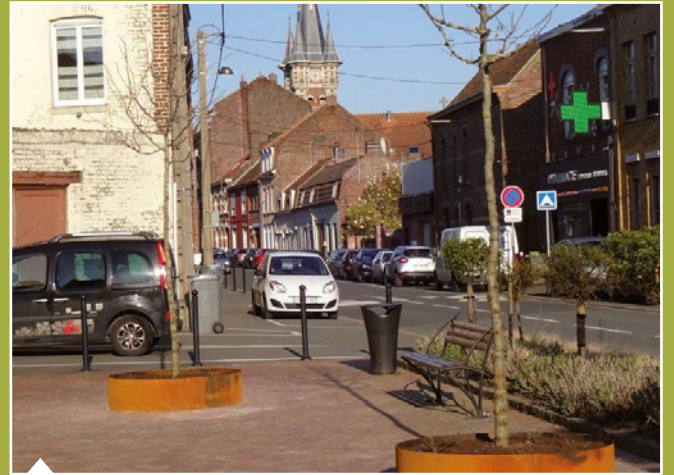
Plantation d'arbres au kiosque.