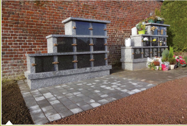
Ajout d'un nouveau colombarium au cimetière.