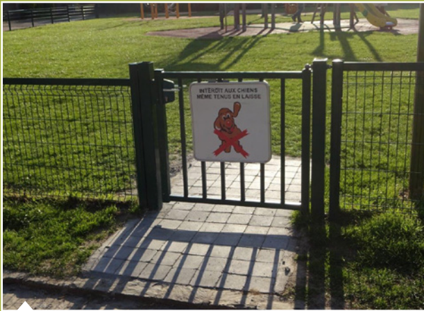
Pavage de l'entrée du parc de jeux au Clos d'Hespel.