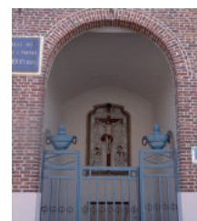
Remise en peinture de la chapelle du Christ de l'abbaye Rosembois