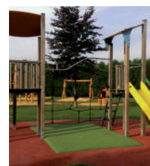
Les nouveaux jeux