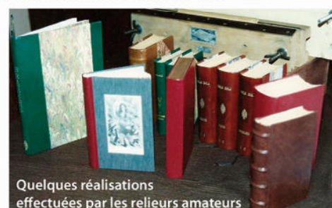
Quelques réalisations effectuées par les relieurs amateurs